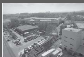
Niektóre z wielu zakładów produkcyjnych

OSTRZEŻENIE dla Konkurencji - Wszelkie upowszechniane dokumenty przez Ulrich (m.in. materiały szkoleniowe, dokumentacje techniczne i handlowe, rysunki, schematy, pojedyncze symbole, piktogramy, powtarzające się sekwencje, zdjęcia, opisy) - jako całość jak i w częściach - są własnością (także intelektualną) Ulrich i są chronione prawem autorskim. Wszelkie prawa do przedruku, powielania, wykorzystywania, przetwarzania - w całości lub części - zastrzeżone. Żadna część niniejszej pracy nie może być reprodukowana, wykorzystywana, przetwarzana bez pisemnej zgody Ulrich, ul. Modlińska 248, 03-152 Warszawa, Polska. W stosunku do osób i podmiotów lamających powyższe zastrzeżenia podejmujemy zdecydowane działania w ochronie naszej własności zarówno podążając do odpowiedzialności karami jak i majątkowej z powództwa cywilnego (m.in. stosując regulacje z Ustawy „O prawie autorskim i prawach pokrewnych” DZ.U. NR 24/1994 oraz inne odośno przepisy). PRZYZWOLENIE dla Wykorzystujących zgodnie z celem - Niniejsze upowszechniane dokumenty przez Ulrich - jako całość jak i w częściach - mogą być wykorzystywane tylko wtedy, jeżeli ma to na celu wzrost sprzedaży Ulrich.