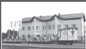
Serwis w Polsce