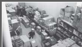
Magazyny w Polsce