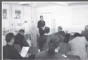
Sala szkoleniowa w Polsce